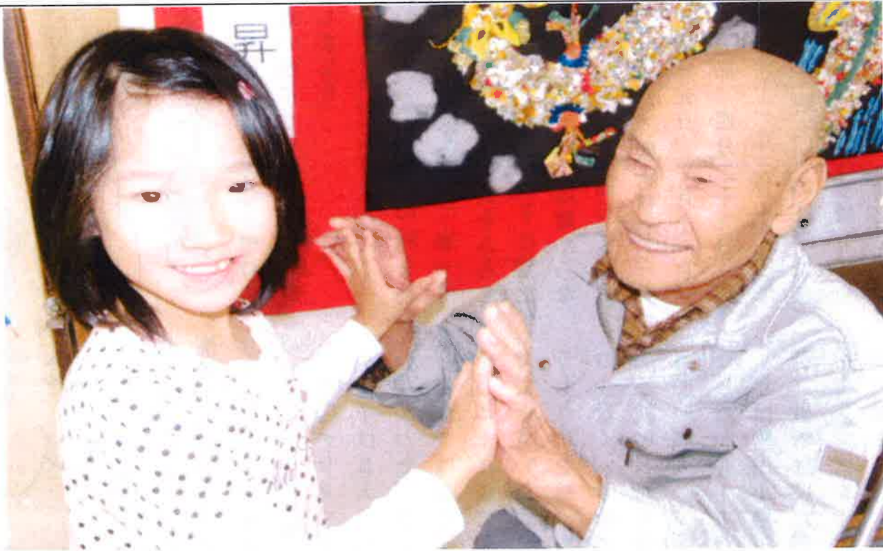
～H25年11月14日：中保育所園児との交流会にて～(※写真と本文は関係ありません)

延命園に来て、早や三十年が過ぎた。延命園の門を初めてくぐった秋の日のことを今でも鮮明に覚えている。