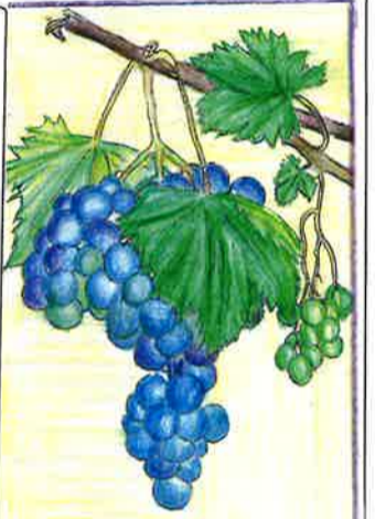
→Nさんの作品(趣味活動のぬりえ)

毎年春に開催されていた、「中島川まつり」では手作りの前掛けや手作りの花を売りに行っていた。二、三ヶ月かけて、寮母さんと一緒にバラ、カーネーション、ポピーや小物入れのカゴなどを手作りした。前日には、自分たちでおつりを準備して、当日に備えた。「花がよく売っていたんですよ。」