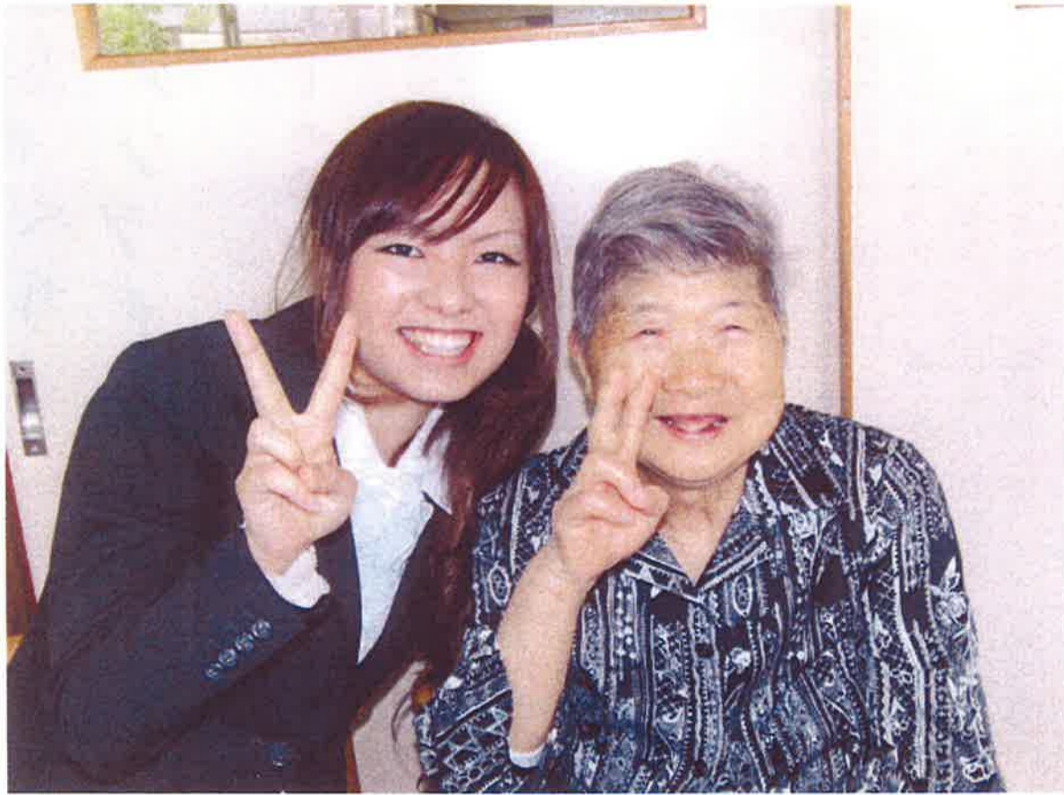
はい、チーズ！89才を迎えたKさん、実習生さんと