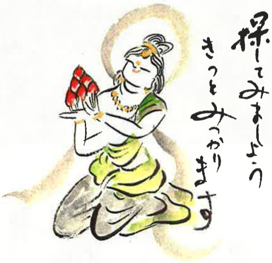
～ 無名の方が寄贈して下さいました作品(複写)～

母が取っておいてくれたんですよ。中身は鉛筆(書き)だから何を書いているかもわからないんだけど。私の宝物です。