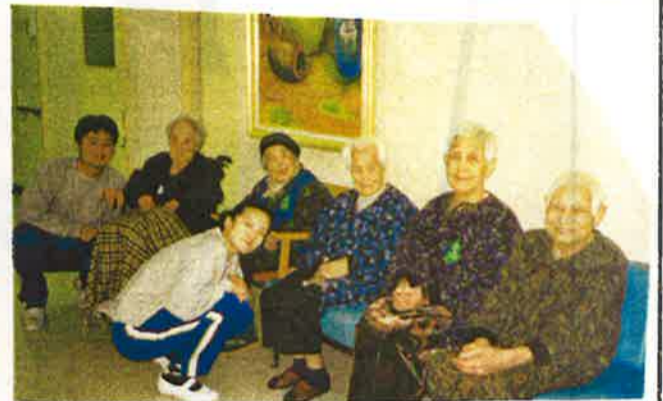
長崎に咲いた神戸の赤い ひまわり(神戸市生田中寄贈)